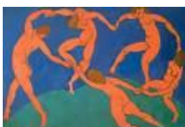
Dancers Henri Matisse