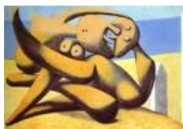
Figures on a Beach Pablo Picasso