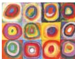
Farbstudie Wassily Kandinsky